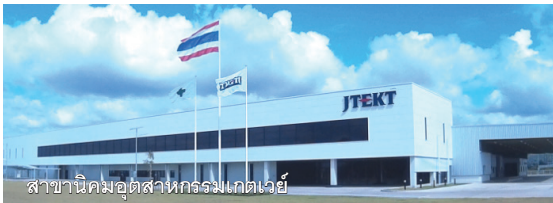
สาขานิคมอุตสาหกรรมเกตเวย์

TYPE OF BUSSINESS: ผลิตและจำหน่ายชิ้นส่วนยานยนต์ ประเภท Bearing , Steering , Driveline Components.