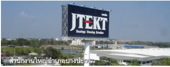
สำนักงานใหญ่อำเภอบางปะกง